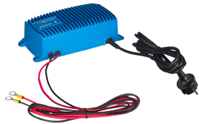
Cargador Blue Smart IP67 12/25