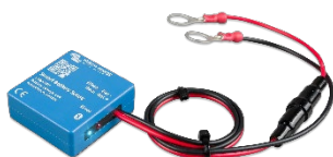
Sensor Bluetooth: Smart Battery Sense