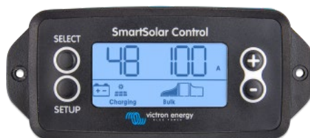
Pantalla conectable SmartSolar

Simplemente retire el protector de goma del enchufe de la parte frontal del controlador y conecte la pantalla.