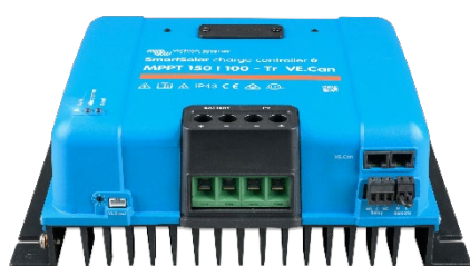
Controlador de carga SmartSolar MPPT 150/100-Tr-VE.Can sin pantalla