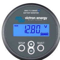
Sensor Bluetooth: Monitor de baterías BMW-712 Smart