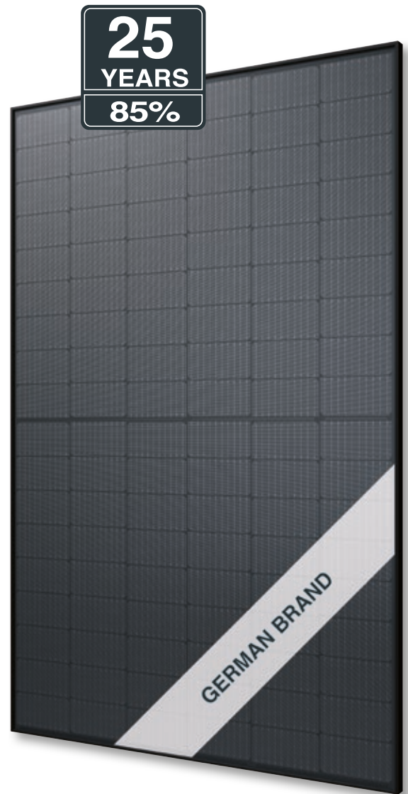
Abb. ähnlich 108MHDE231009A