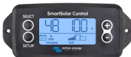
Pantalla conectable SmartSolar

Simplemente retire el protector de goma del enchufe de la parte frontal del controlador y conecte la pantalla.