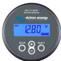
Sensor Bluetooth: Monitor de baterías BMV-712 Smart