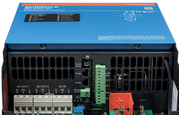
Área de conexión

Mide la tensión y temperatura de la batería y permite el seguimiento y control mediante smartphone u otro dispositivo bluetooth.