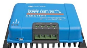
Controlador de carga solar MPPT 150/70-Tr