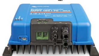
Controlador de carga solar MPPT 150/70-MC4