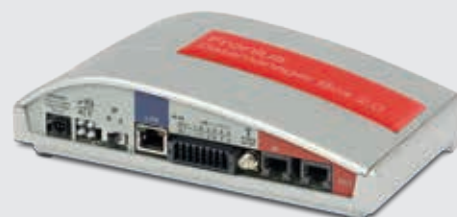
/ Fronius Datamanager Box 2.0